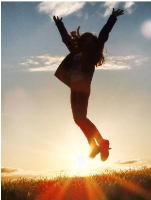
Ausbildung zum Leitenden

Dabei kannst du dich auf abenteuerliches und interessantes Programm freuen, wie zum Beispiel: 😊