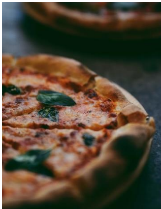
Pizzaessen in Locarno