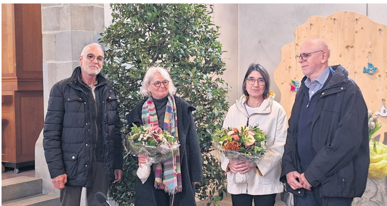
Abschied des Kirchenkaffee-Teams im Gottesdienst vom 15. März 2026